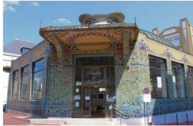
Le Pavillon du verdurier

Construit en 1919 par Roger Gonthier, architecte de la gare des Bénédictins, ce bâtiment a servi de pavillon frigorifique, puis de gare routière, avant d'être restauré par la mairie de Limoges pour devenir un lieu d'expositions en 1978.