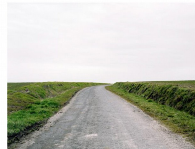
Alexis MANCHION Cartes postales

A partir d'un polaroid dont le visage s'est effacé avec le temps, j'aborde par le coloriage ou des matériaux appartenant à l'univers féminin (maquillage) la condition de la femme à travers plusieurs aspects : la féminité, la maltraitance et les problématiques identitaires.